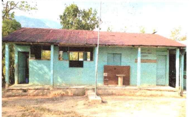
Foto 6: se observa que el techo del establecimiento esta en malas condiciones está muy deteriorada y oxidada por completo.

Observación: Si es necesario se pueden agregar hojas adicionales y actualizar el número de hojas.