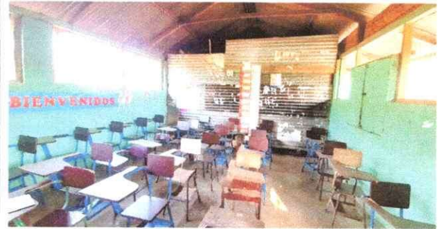
Foto 2: se observa que la parte de adentro esta dividida con laminas, pisos con grietas y muy estrecha, donde se realizará un mantenimiento de preventivo.