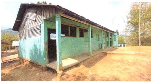
Foto 1: se observa que el establecimiento esta forrada con laminas deterioradas.