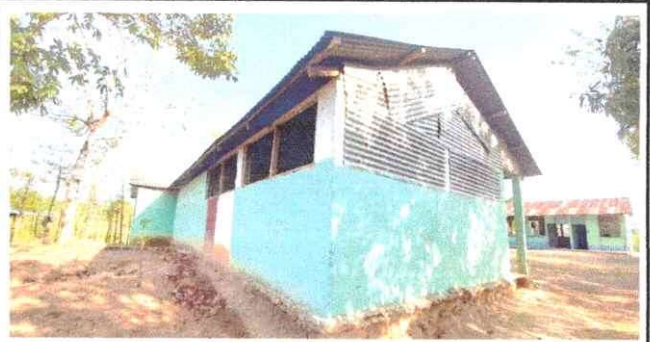
Foto 4: se observa que el cimientto esta completamente en malas condiciones y las paredes con grandes grietas.