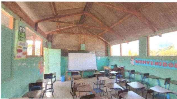
Foto 3: Se observa que las maderas que sostiene el techo estan calcamidos por los comegenes.