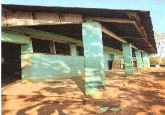
Foto 5: Se observa que los horcones estan completamente en malas condiciones, deterioradas con grandes grietas.